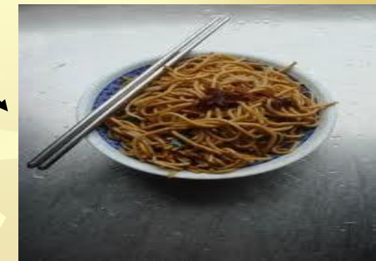
Chow Mein/ Fried rice noodles